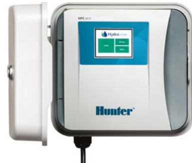
HPC (Kunststoff Innen-/Außenmontage) Höhe: 22,9 cm Breite: 25,4 cm Tiefe: 11,4 cm

Testen Sie die Hydrowise-Software direkt, auch ohne Steuergerät unter hydrowise.com